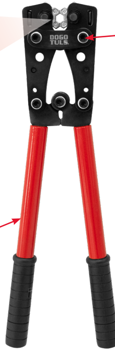
SEGUROS DE LA MORDAZA